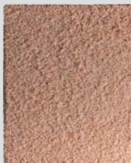
PAMPAS Ampla e Serena