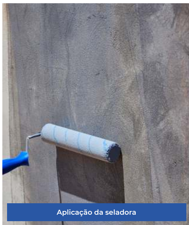
Aplicação da seladora