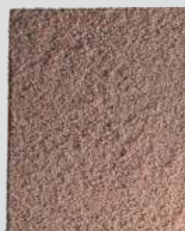
CERRADO Terrosa e Resiliente