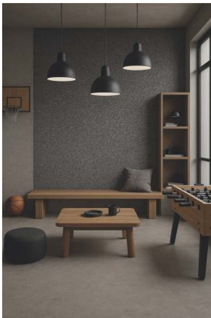
Sala de jogos

A Coleção Metrôpoles é um reflexo do estilo urbano, da arquitetura marcante e da sofisticação silenciosa das cidades que moldam o mundo.