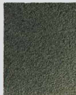
FLORESTA AMAZÔNICA Densa e Exuberante