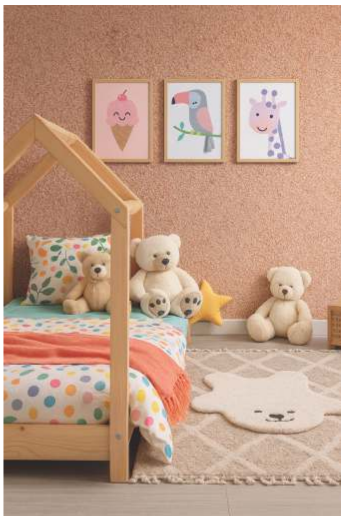
Dormitório Cor: Pampas Coleção Vegetação

Cores que mesclam tons terrosos, neutros e nuances ousados e queimados, refletindo a força, a beleza e a diversidade da natureza brasileira.