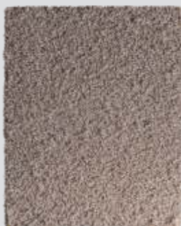
CAATINGA Árida e Autêntica