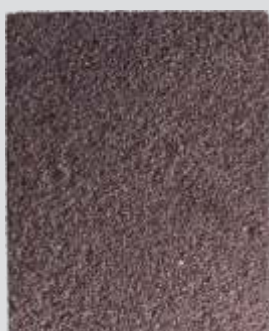
PANTANAL Fluida e Misteriosa