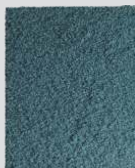
MATA ATLÂNTICA Úmida e Vibrante