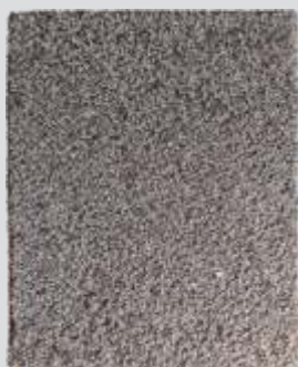
COCAIS Tropical e Acolhedora