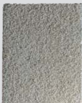
LITORÂNEA Fresca e Luminosa